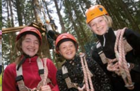
Action pur - hier ist immer etwas los