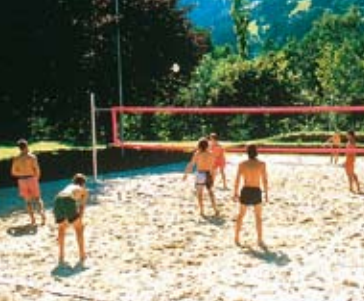
Beachvolleyball - Freizeitpark Zell